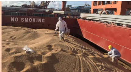
(专班人员正在开展大豆取样)

为最大程度降低新冠病毒感染风险，专班采用“专人、专车、专点”以及“外轮-集中隔离居住场所”两点一线的模式进行集中统一管理。在为期14天的登临外轮作业期内，一线作业人员每2天进行一次核酸检测，14天换班后还需进行7天的集中隔离，再进行7天居家隔离确认身体健康后才能重新上班。