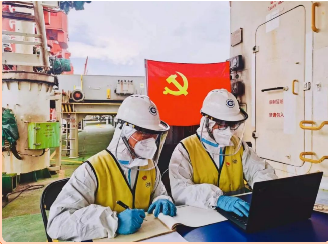
(党员带头冲锋一线)

下一步，防城港分公司将继续坚决贯彻落实好公司党委的各项工作要求、将持续完善各项工作机制，推行科学的组织调度机制、专班推进机制、综合协调机制，充分发挥专班管理的导向作用，全力保障员工生命安全、保证工作质量和业务的稳步增长。