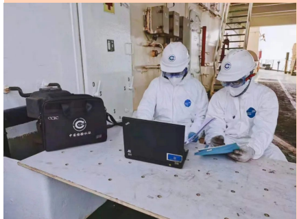
（专班人员正在进行水尺计算）