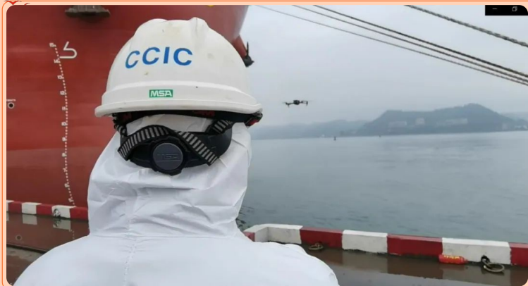
（专班人员正在操控无人机进行水尺观测）

随着新冠肺炎疫情形势日趋严峻，为做好港口及其一线人员新冠肺炎疫情防控工作，中国中检广西公司防城港分公司实行了“14+7+7”的专班管理，将内贸轮和外贸轮严格区分，严格落实疫情防控相关规定，筑牢疫情防控安全防线，守住疫情底线。