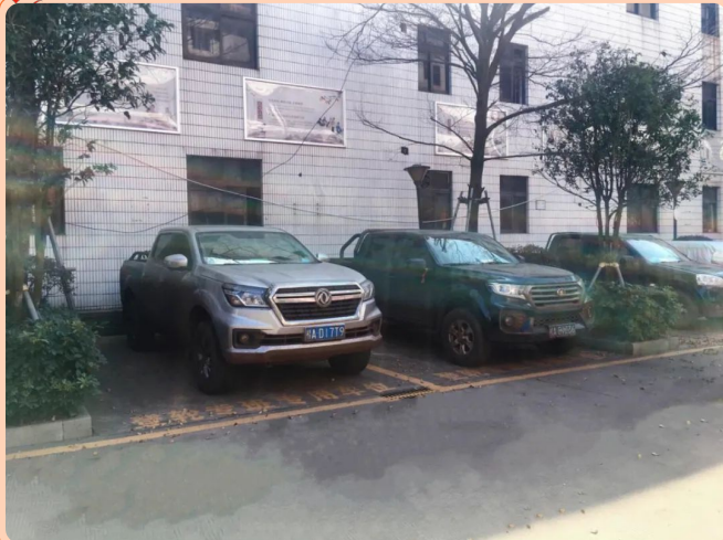
(登临外轮专班专用车位)

自实行“集中隔离居住”管理以来，广大员工主动“请战”加入“14+7+7”专班，坚守业务一线。从接种过加强疫苗、持有登轮证、核酸检测阴性的一线党员、业务骨干中选拔出专班人员，确保定岗定岗定岗定岗，两点一线，整个过程做到严谨不信谣